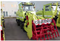
▲小型ロータリ除雪車

それではここで除雪車の紹介をいたします!除雪車は様々な種類があり、それぞれ役割が違います🚚 雪を道路脇に寄せたり、凸凹(デコボコ)になった路面を削って平らにしたり、色々な場面で活躍します♪