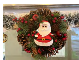
クリスマスリース!