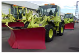
▲タイヤショベル(除雪ドーザ)