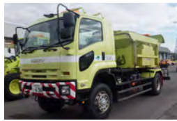
▲凍結防止剤散布車