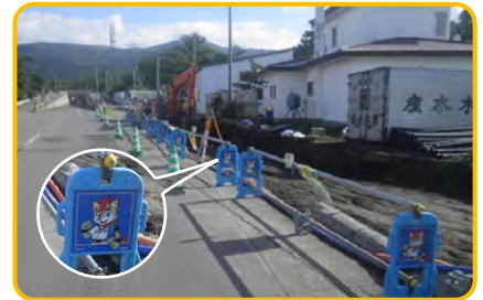
● ファイターズ模様のバリケード