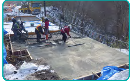
● コンクリート床版 生コン打設