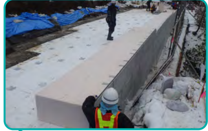
● EPSブロック用壁面材設置

10月中旬から施工開始し、3月下旬施工完了予定です。安全第一で作業に励んでいます。皆様にはご迷惑をおかけしますが、ご理解のほどよろしくお願いいたします。