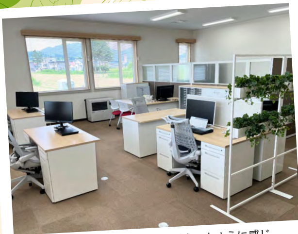
白の効果で事務室が明るくなったように感じ 心も晴れやかになりました(*^^*)