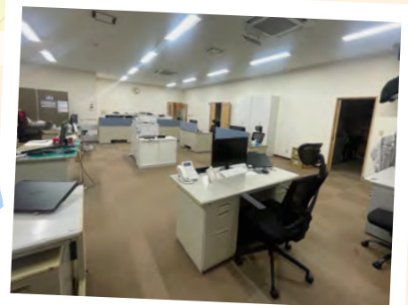
以前は統一感がなく、殺風景な印象でしたが...

なんと!! 工事事務と経営管理部の場所が入れ替わるとい う大幅な変更がありました😊